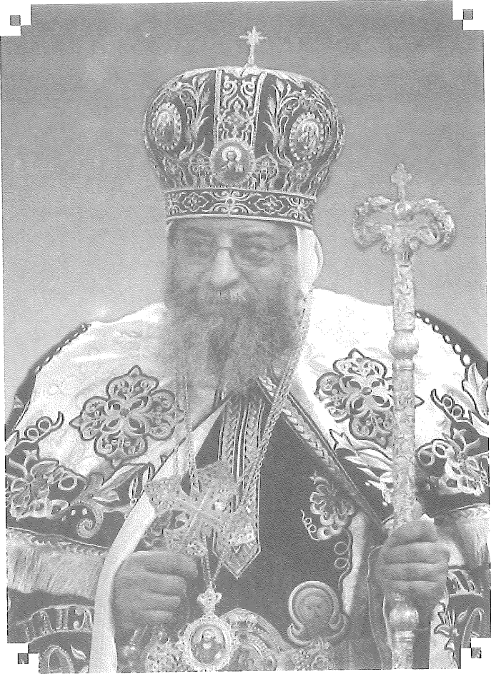
صاحب الغبطة والقداسة البابا المعظم الأنبا تواضروس الثاني بابا الإسكندرية وبطريك الكرازة المرقسية (١١٨)